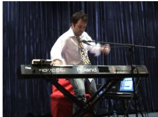
Frank lors du concert le 10 mai 2008 au Centre culturel français de Pékin

Après le concert, Frank a répondu aux questions des journalistes de la CCTV venus filmer le spectacle et ceux du magazine « Pekin JO 2008 » produit par Hikari Productions.