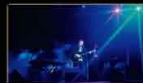
PETRA (Jordan) - September 2001