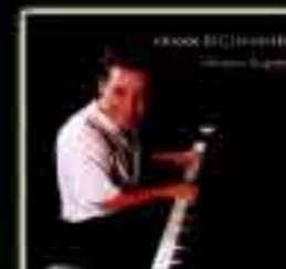
TOURNER LA PAGE (Album) 1998