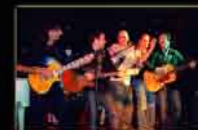
"LE SATIN DOLL" (Bordeaux) November 2005