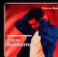
PETRA LA ROSE (Maxi single) 2001