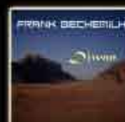
DIWAN (Album) 2003