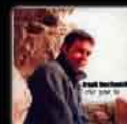
CRIER POUR TOI (Maxi single) 2002