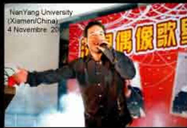
NanYang University (Xiamen/China) 4 Novembre 2007