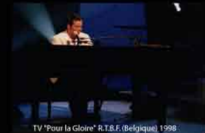
TV "Pour la Gloire" R.T.B.F. (Belgique) 1998