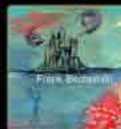
LP - CE QUE JE VAUX Wild Palms Music, 2006