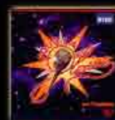
IMAGINE (RTBF/ Pias) (Single) 1997