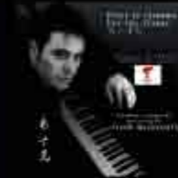
Pour la Flamme / For the flame 2007

" A Frank, aux doigts de fée, longue et belle carrière, à mon avis c'est pour bientôt ! " Francis CABREL (Astaffort, mars 2000)